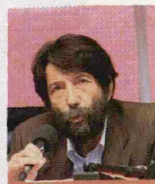
Sopra, un laboratorio per Leggevamo 4 libri al bar . A destra, Massimo Cacciari, al Festivalfilosofia di Modena; sotto, il Women's Fiction Festival .

✓ Women's Fiction Festival A Matera , dal 29 settembre al 2 ottobre, scrittrici come Giusy Torregrossa e Ritanna Armeni e lettrici si incontrano per parlare di storie al femminile. Info: www.womensfictionfestival.com .