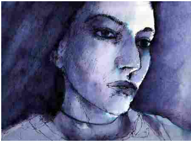
- RIPRODUZIONE RISERVATA