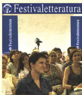
A MANTOVA DAL 5 AL 9 SETTEMBRE. INFORMAZIONI SU WWW.FESTIVALETTERATURA.IT

Un punto di incontro tra scrittori e lettori, nel corso di reading di poesia, presentazioni di libri e spettacoli musicali. Succede a Mantova che per l'occasione si mette in mostra con percorsi guidati alla scoperta del suo patrimonio storico-culturale. Laboratori e spazi sono dedicati anche ai bambini.