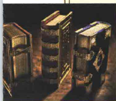
A FIRENZE DALL'11 SETTEMBRE AL 20 OTTOBRE. INFORMAZIONI SU WWW.MAGNIFICITRE.IT

Tre codici miniati fatti realizzare come doni nuziali alla fine del '400 da Lorenzo de' Medici, detto il Magnifico, per le figlie Lucrezia, Luisa e Maddalena. Per la prima volta dopo cinque secoli sono esposti insieme a Firenze alla Biblioteca medicea Laurenziana. Si tratta di tre lussuosi "libri d'Ore" (cioè di preghiere).